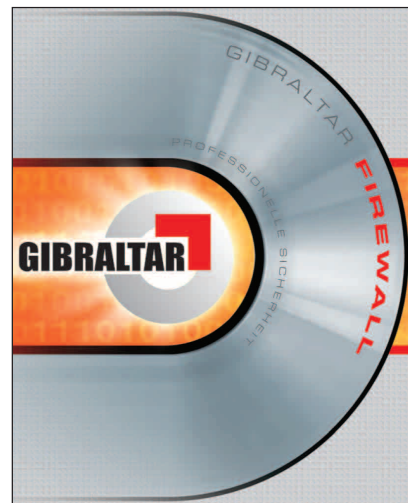
Die Linux-Firewall Gibraltar läuft direkt von einer Boot-CD

Gibraltar kommt mit ein paar sehr vernünftigen Standardfirewallregeln daher: